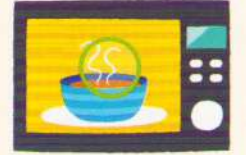
microwave cuptor cu microunde