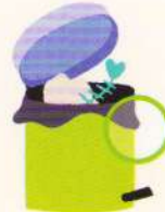
bin coș de gunoi