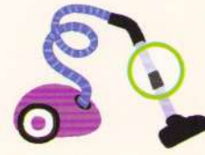
vacuum cleaner aspirator