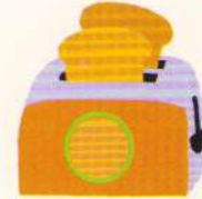
toaster prăjitor de pâine