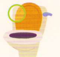
toilet vas de toaletă