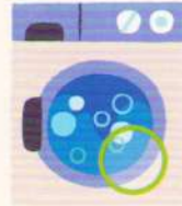
washing machine mașină de spălat