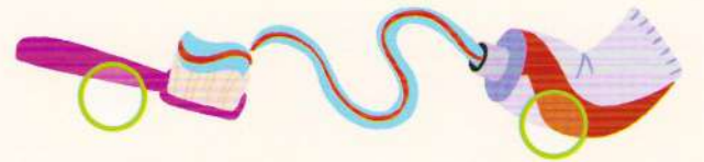
toothbrush periuță de dinți