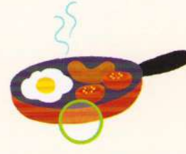
frying pan tigaie